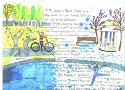
Рисунок Марии Завьяловой, 5 В

Общение с ровесниками из другой страны на английском помогает улучшить свои собственные знания языка. Я хотел бы продолжить общение по электронной почте. Террачина сильно отличается от Петрозаводска. У них более тёплый климат, их город старше нашего. Древнеримскому Храму Юпитера, который возвышается над городом, почти 2,5 тысячи лет! Мне также было интересно узнать, что школа «Милани» - эко-школа. Дети заботятся об окружающей среде.